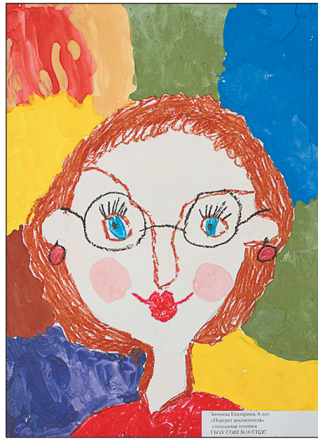
СПДС «Красная шапочка» ГБОУ СОШ №16 г.о. Жигулёвск