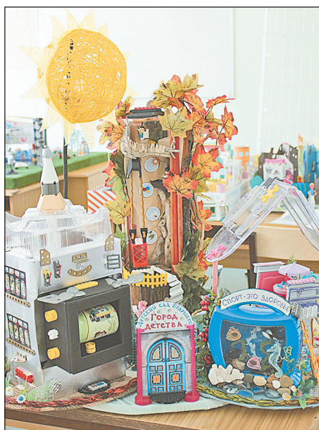
СП «Детский сад «Бабочка» ГБОУ ООШ № 6 г. Новокуйбышевска

Одно из зданий оборудовано как большой зимний сад, где находятся уголок зимнего леса, террариум с пресмыкающимися и пресноводными, декоративные фонтаны, фитобар; оборудованы мини-центры для исследовательской и элементарной трудовой деятельности. На территории детского сада имеется дендропарк, минизоопарк с детёнышами домашних животных, создан интересный ландшафт: цветники, альпийские горки, искусственные ручьи и водопады, песочные дворики,