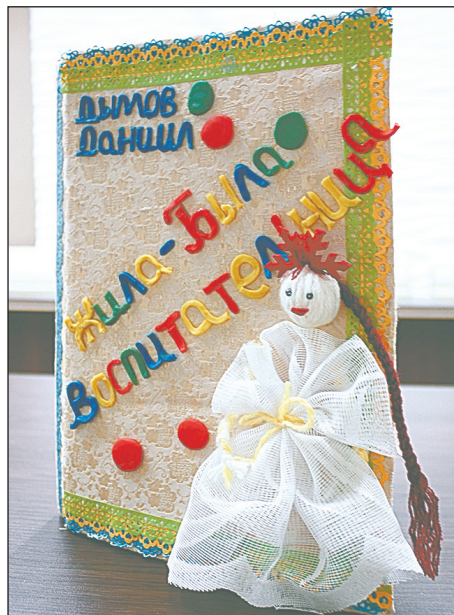
СП «Детский сад № 69» ГБОУ СОШ № 6 г.о. Сызрань

Прознали об этом малыши-крепыши и стали «голову ломать», как злых пира- тов победить, замок отстоять и не отдать