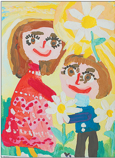
МБУ детский сад № 49 «Весёлые нотки» г.о. Тольятти